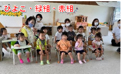
ひよこ・緑組・赤組

8月から支援センターの『お話の会』に参加させてもらっています。子どもたちは絵本が大好きです。